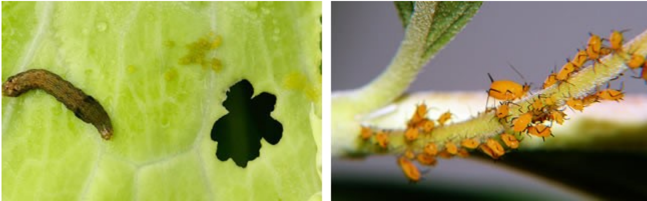
Plagas de cultivos. Spodoptera (Lepidóptero) y Áfidos. Bajo licencia Creative Commons (1) autor: Mohd Masri Saranum; (2) autor: Giuseppe Lotito

-Control de plagas y enfermedades: para combatirlos, se han venido utilizando desde hace tiempo productos químicos ( fungicidas, plaguicidas ).