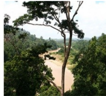
Imágenes de bosque tropical, bajo licencia de Creative Commons (1) autor:Carlows, (2) autor:mikelopoulos,(3) autor:A. Lawson