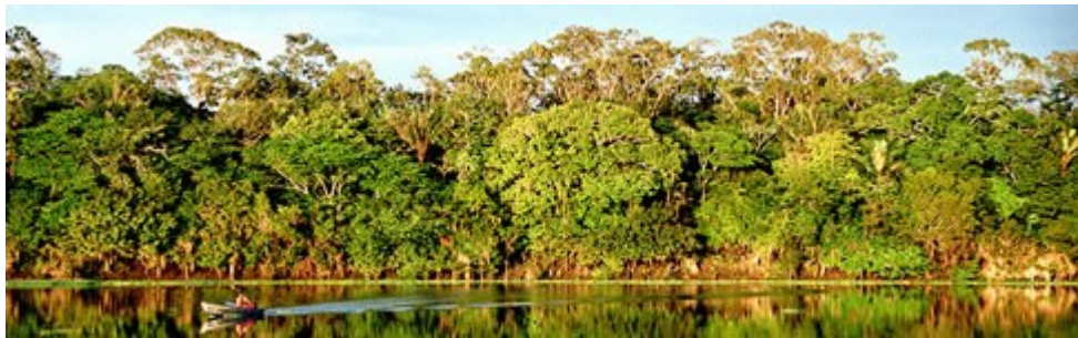
Rio Amazonas y Selva.

Las plantas son importantes para los seres humanos por: