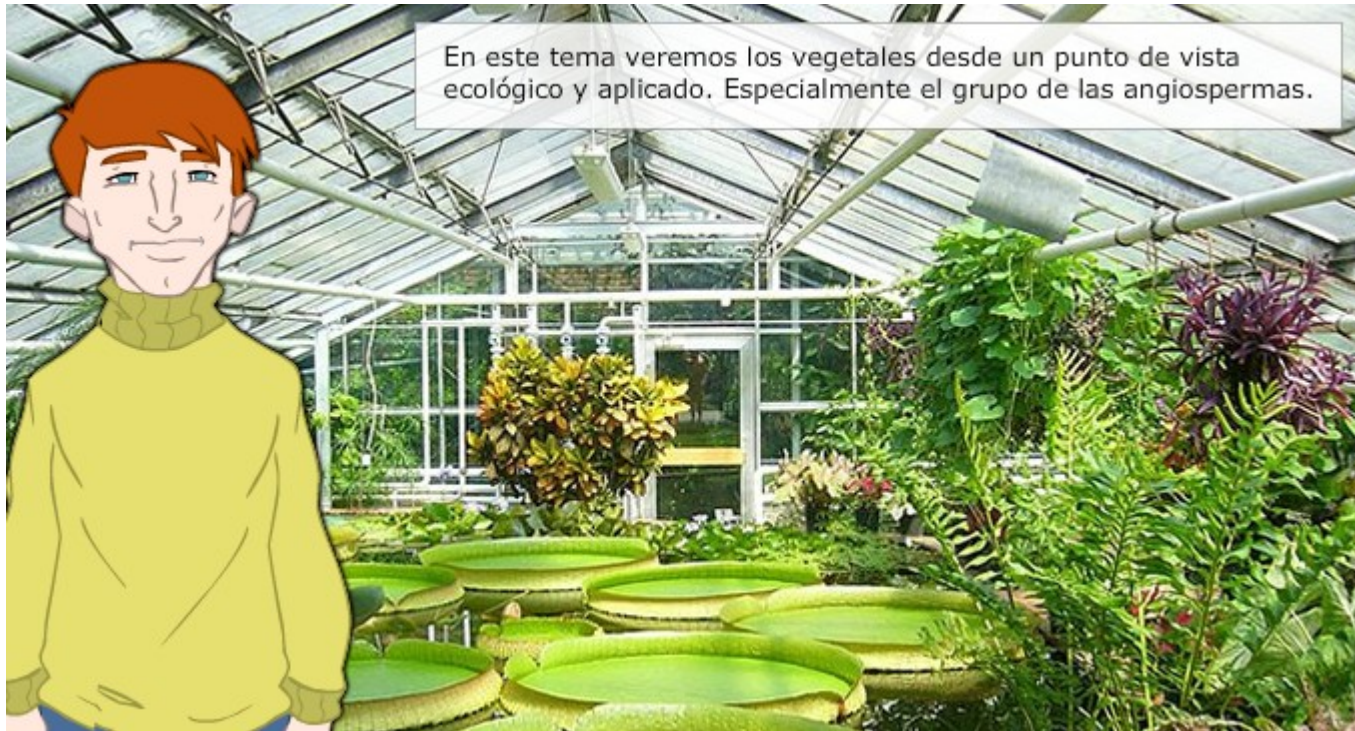
Imagen de invernadero de dominio público, autor: Mattes.