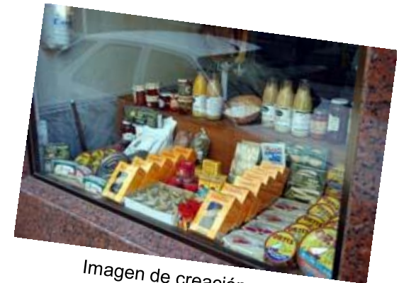
Imagen de creación propia