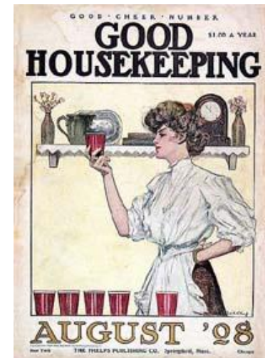
Imagen de dominio público