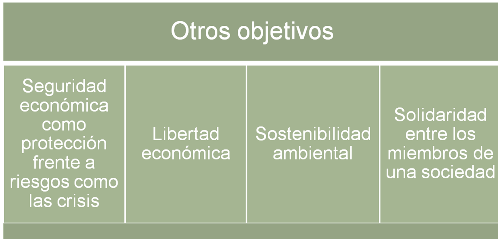
Imagen 3.

En las sociedades actuales además de la eficiencia también se persigue el objetivo de equidad , a través de una distribución más justa de la renta que corrija las desigualdades.