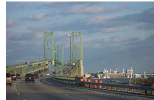
Imagen 2. Autor: Desconocido . Imagen de dominio público.