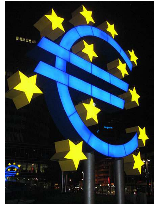
Imagen 1. Autor: Desconocido . Creative Commons Sharealike 1.0 License.

Es el conjunto de medidas tomadas por el Banco Central Europeo para alcanzar unos objetivos de crecimiento económico, empleo e inflación mediante la modificación de los tipos de interés y la oferta monetaria.