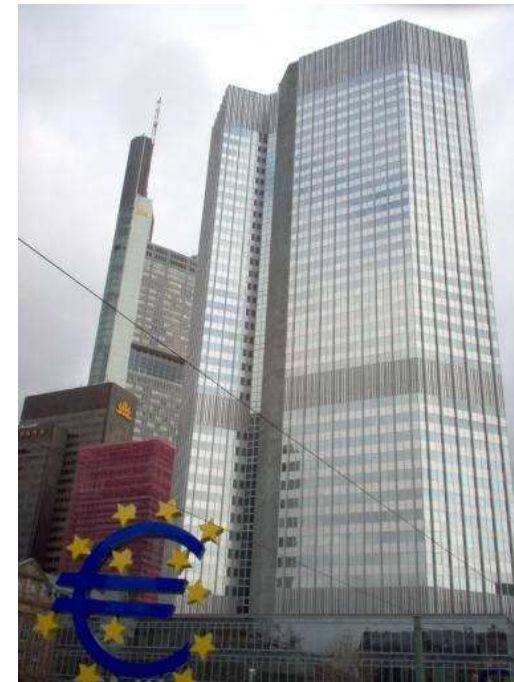
Imagen 4. Autor: Eugene Van der Pijl . Imagen de dominio público.