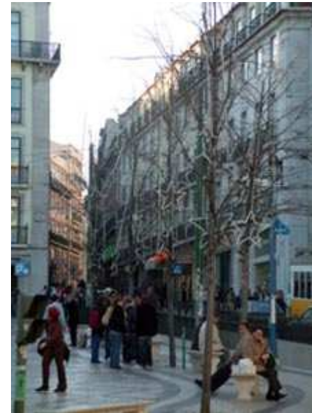
Imagen 5. Autor: Creación propia.