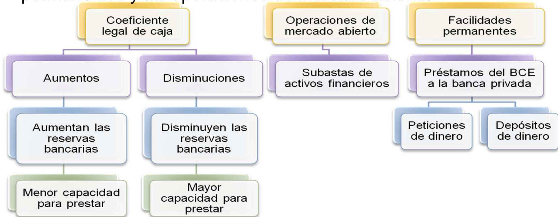
Imagen 3. Autor: Creación propia.

Son los cambios en el coeficiente legal de caja, las facilidades permanentes y las operaciones de mercado abierto.