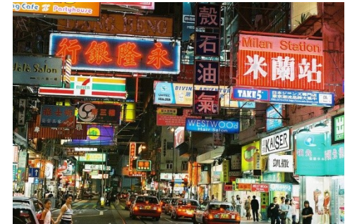
Imagen 1. Autor: Ángel Riesgo. Creative Commons Attribution Sharealike 2.0 License.