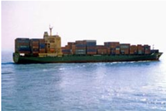
Imagen 2. Autor: Desconocido. Creative Commons Attribution Sharealike 2.5 Generic License.