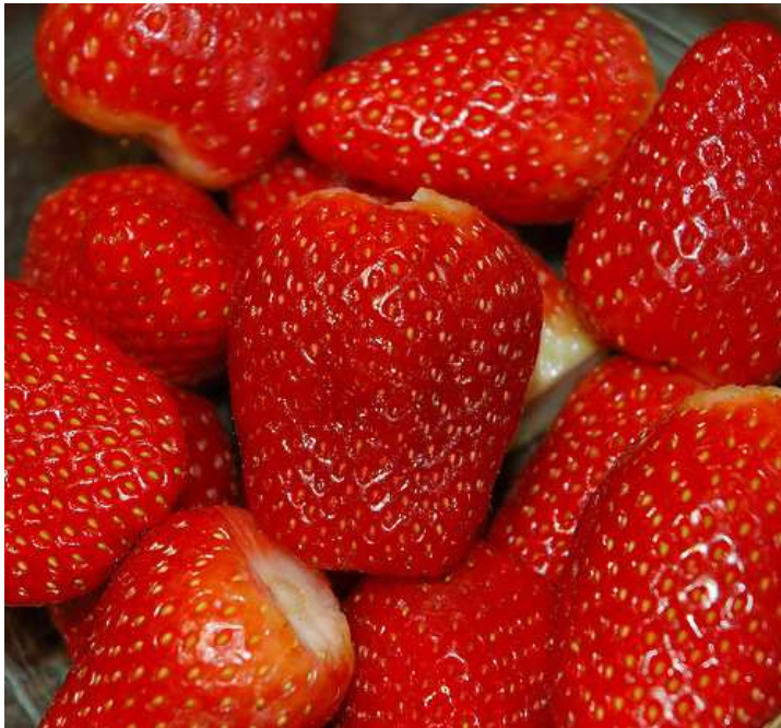
Imagen de Bichuas