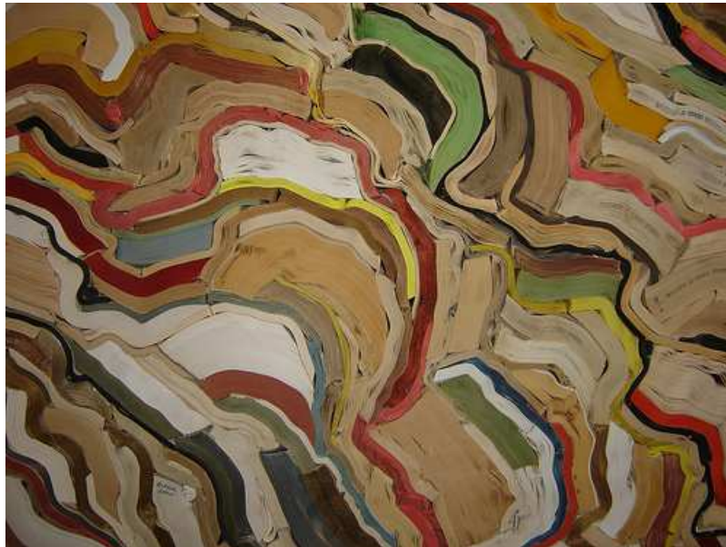
Imagen de Herbert Spencer con licencia CC BY-SA 2.0